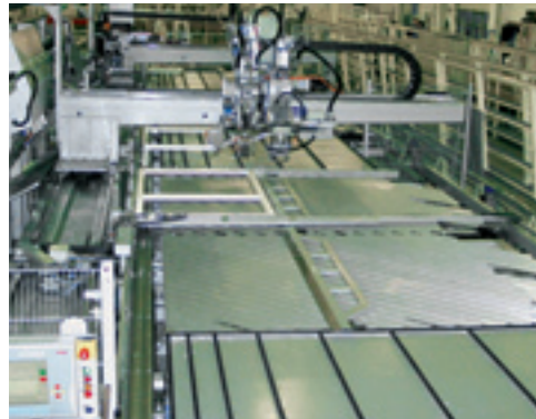
Автоматический монтаж рамных элементов

Оконный рынок развивается все быстрее. Более короткие инновационные циклы и постоянно растущее разнообразие вариантов продукта ставят задачи, которые подчас негативно сказываются на эффективности производства. Чтобы не потерять свои позиции на рынке и добиться максимальной отдачи, необходимо постоянно проверять производство на соответствие актуальным требованиям и быть готовым к текущей оптимизации.