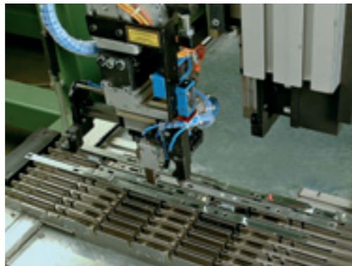
Автоматический монтаж створочных элементов Roto NT

Успешная реорганизация производственных процессов предполагает активное участие всех сотрудников. Поэтому мы предлагаем внедрение работы в команде, благодаря которому возможно повышение производительности на Вашем предприятии на 15–25 %.