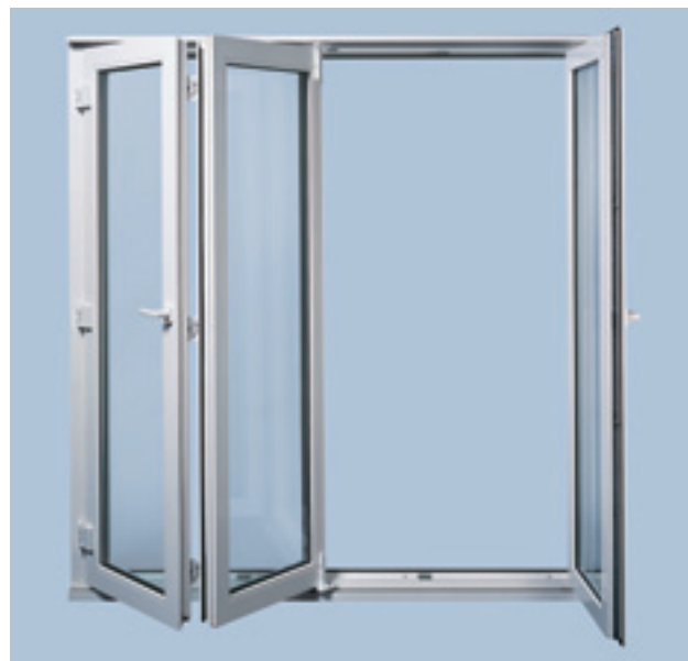
Patio 6080 с установленной поворотнo-откидной створкой.

Alu Patio 4150S/Z – идеально подходит для окон и дверей, которые должны открываться полностью и при этом не занимать много места, особенно в школах, больницах, офисах, а также при создании террас и зимних садов. Благодаря плотному запираению эта система обладает первоклассной звуко- и теплоизоляцией. Преимуществом является использование стандартных профилей для створок и рам. Сдвижной механизм обладает легким ходом и мало изнашивается. Система Alu Patio 4150S/Z может быть дооснащена противовзломными элементами. Возможно изготовление наклонно-раздвижных систем шириной от 630 до 1880 мм и высотой от 930 до 2430 мм.