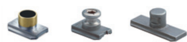
MVS магнитный датчик

Дополнительные элементы. По желанию заказчика систему можно доукомплектовать противовзломными элементами, обеспечив определенный класс безопасности окна (до WK 4). При самых высоких требованиях рекомендуется совместное использование механических и электронных элементов безопасности системы Roto E-Тес. (Например, Roto MVS магнитного датчика).